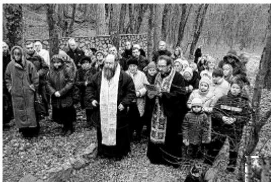
Молебен в Багреевке у часовни во имя иконы Божией Матери «Знамение» Курской Коренной.

Ялта — особое место в русской истории. Город, где люди жили, отдыхали, любясь великолепной природой, город, где в годы красного террора проливались реки человеческой крови. Память невинно убиенных увековечена в часовне-памятнике во имя иконы Божией Матери «Знамение» Курской Коренной в Багреевке, недалеко от водопада Учан-Су. Она воздвигнута на том месте, где с декабря 1920 года по март 1921 года были расстреляны и сброшены в водосборный бассейн тысячи местных жителей: юристов, врачей, учителей, музыкантов, служащих различных учреждений и ведомств.